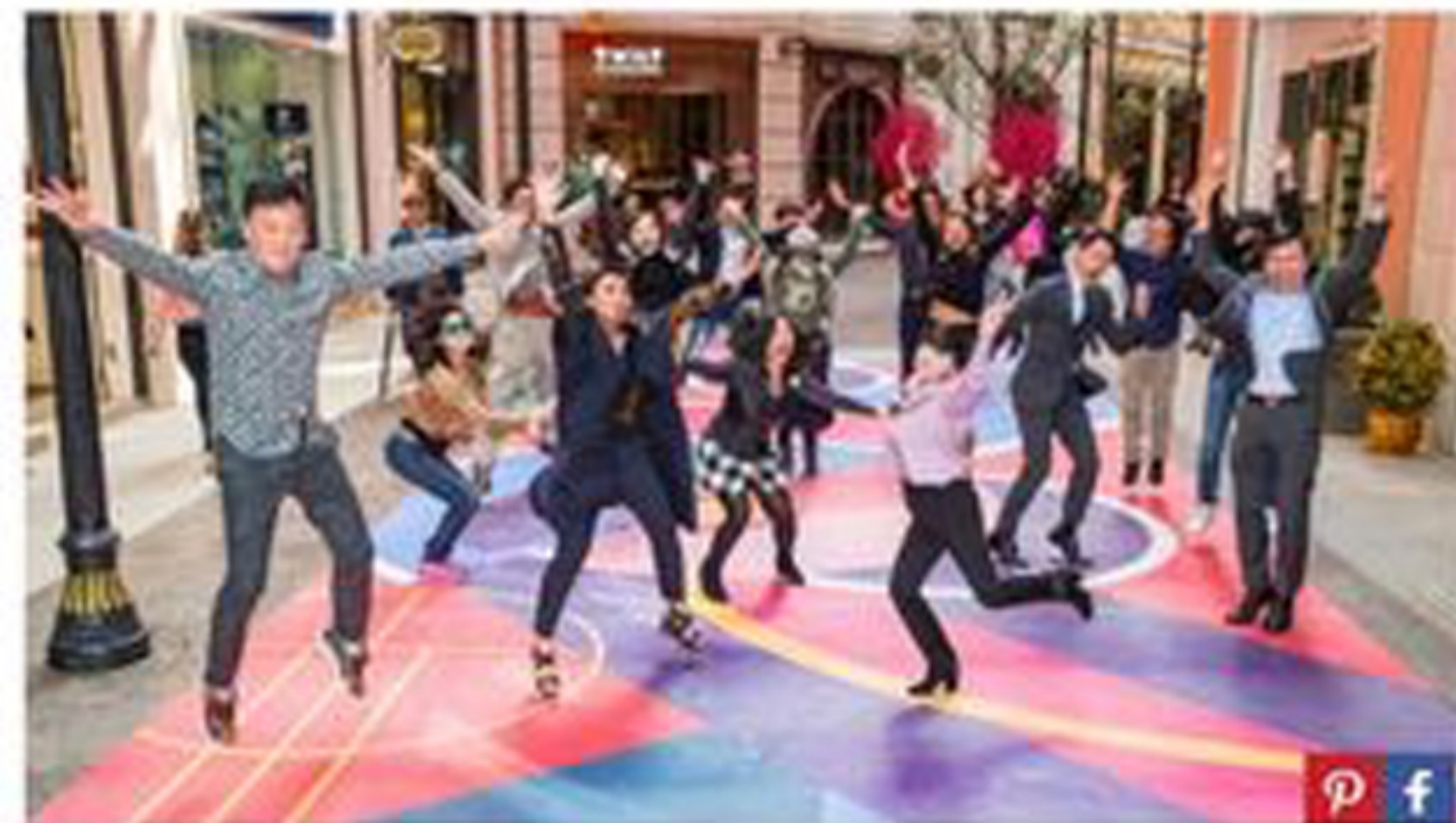
In the mood for love