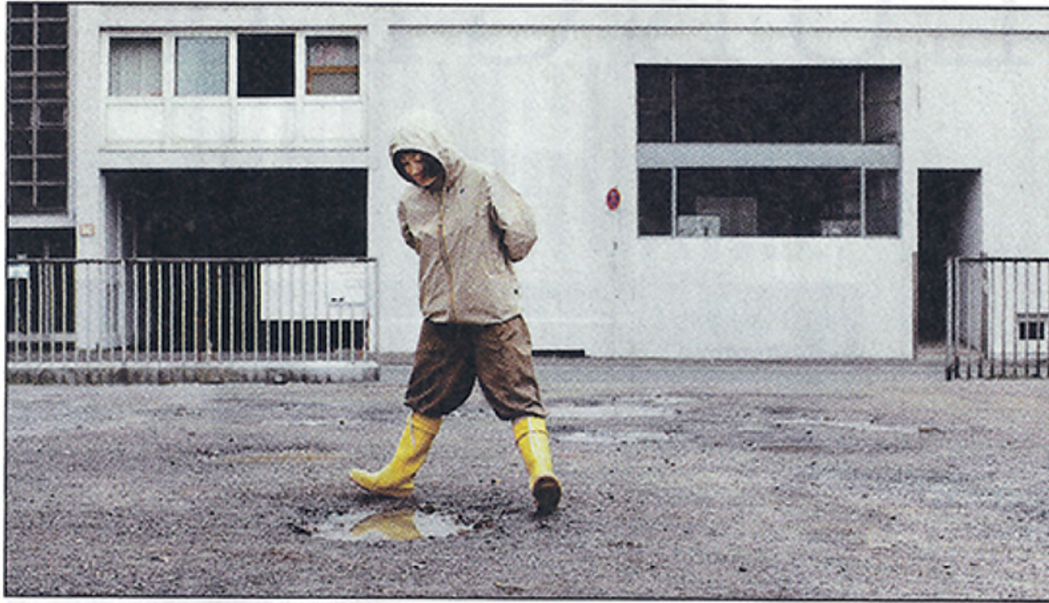
3 | Ob Sonne oder Regen: Die KHM lädt zum Rundgang (Sebastian Gimmel: »approaching the puddle«)