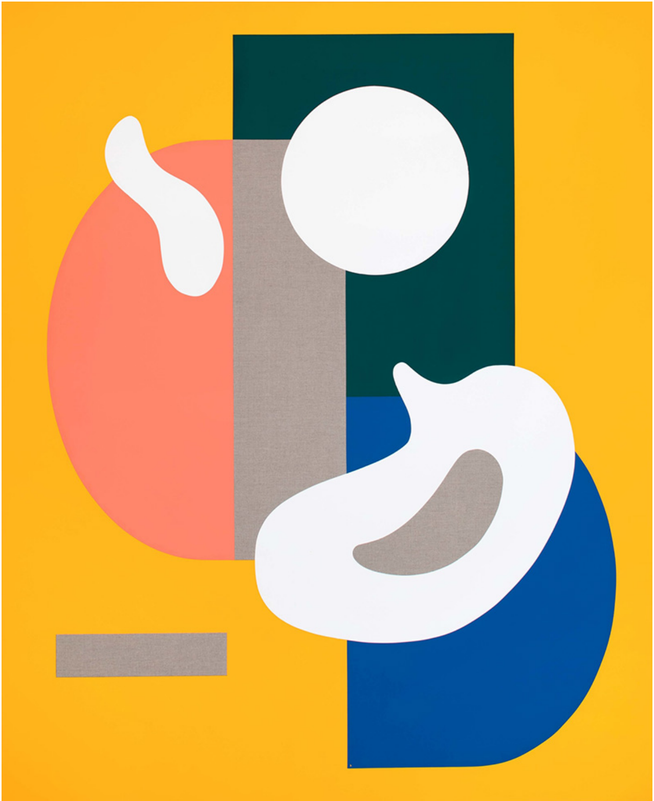
CITRINE AND EMERALD, 2021 Pintura al temple sobre lino 160 x 130 cm

1598, el astrónomo holandés Petrus Planchius convirtió al pájaro en una nueva constelación). El espacio se ve aún más elevado por los sonidos atmosféricos de dos aves del paraíso haciendo el amor, que se reproducen a través de dos altavoces antiguos, creando una sensación de circularidad a medida que la exposición llega a su fin. Al mismo tiempo, es significativo que el canto de los pájaros tome el relevo de la narración humana, tal vez señalando una sensación de libertad justo cuando las pinturas abrazan una sensualidad recién descubierta.