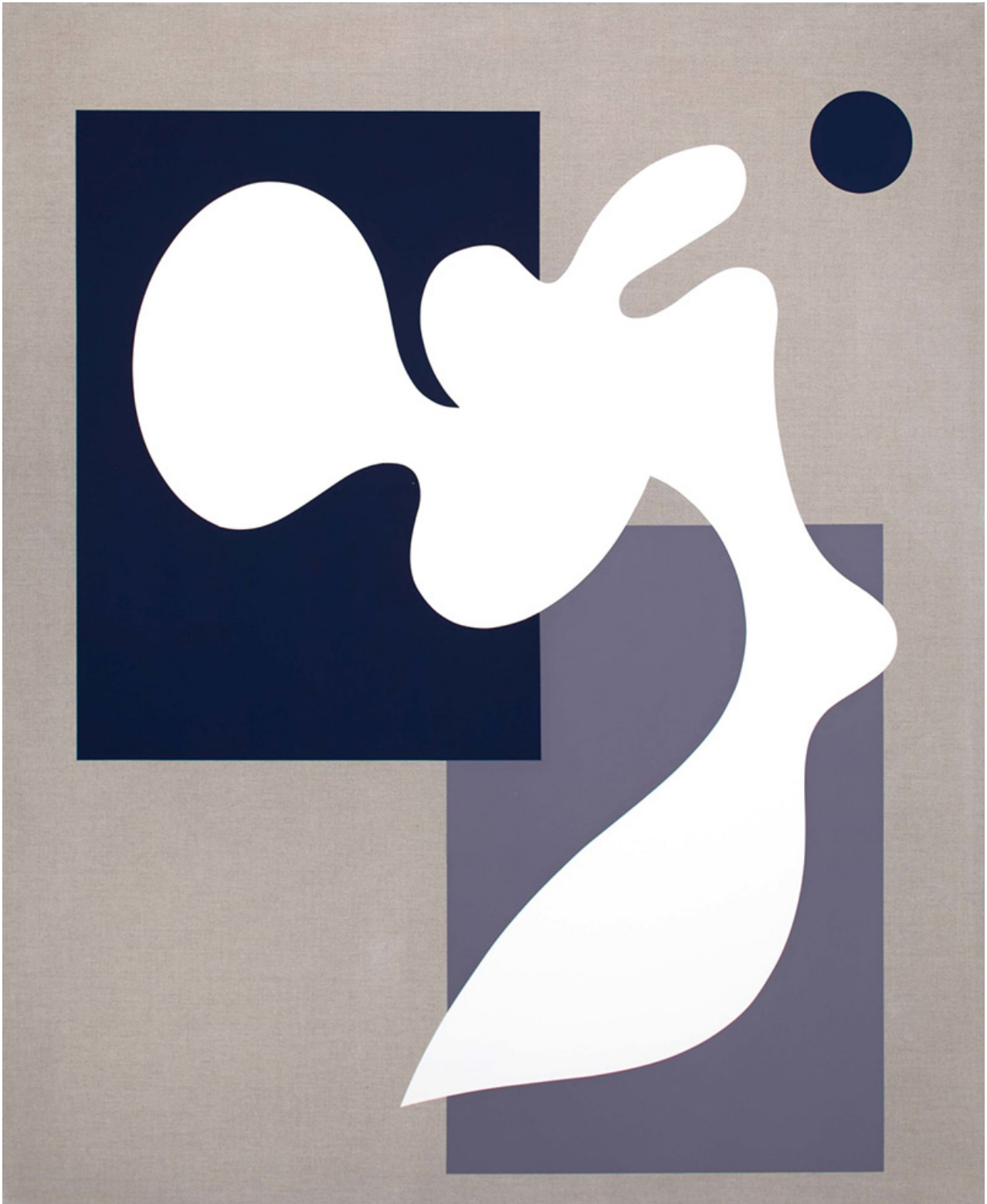
BLACK AND WHITE IS WRITING, 2021 Temple sobre lino 160 x 130 cm

movilidad de las aves; Algunos razonaron que, dado que no podían aterrizar en la tierra, las aves del paraíso debían estar eternamente en el aire y, como tales, se las comparaba con ángeles caídos .