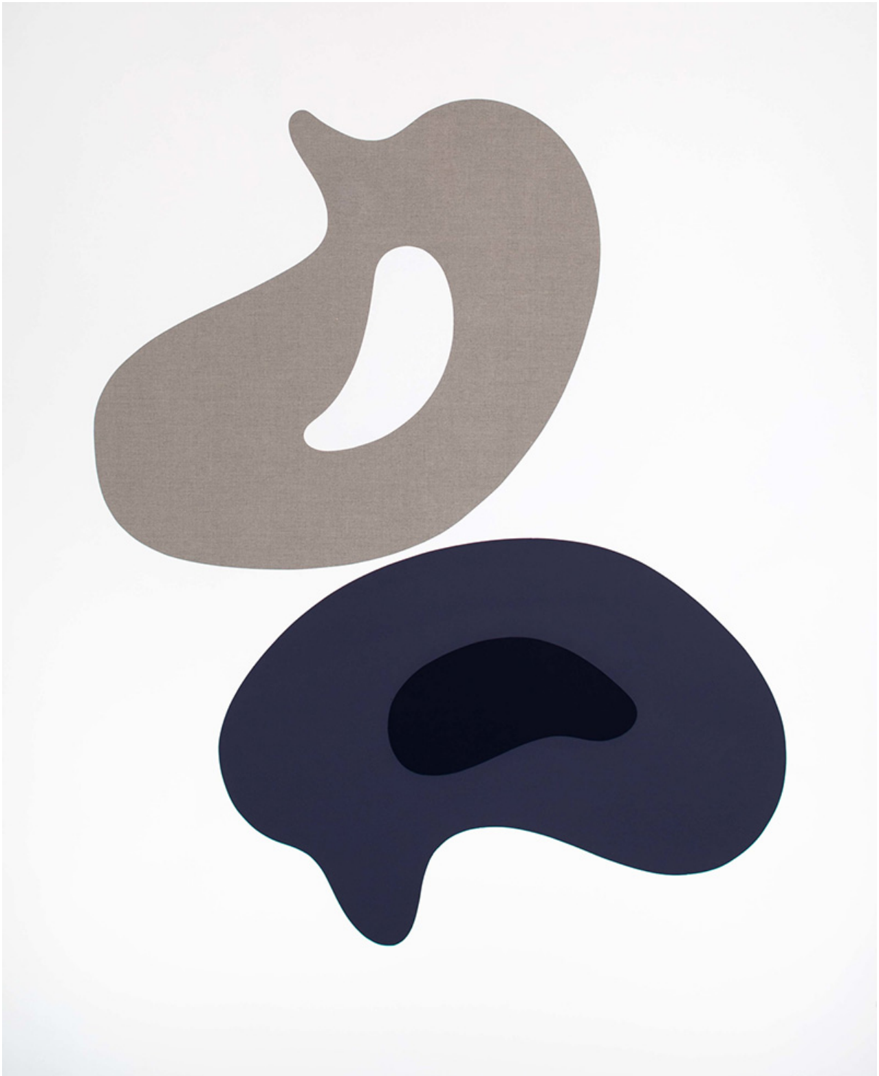
LOVEMAKING & CIRRI, 2021 Temple sobre lino 160 x 130 cm

La pintura titulada Lovemaking & Cirri , por ejemplo, evoca el misterioso cortejo de los pájaros a través de formas suaves y sensuales representadas en tonos apagados, mientras que la obra de arte Black and White is Writing , que toma prestado su nombre de Jean Arp , equilibra formas orgánicas y geométricas. A lo largo de la exposición, hay una tensión palpable entre movimiento y quietud , que resuena con las narrativas que rodean al ave del paraíso. Los cazadores en Nueva Guinea tradicionalmente les quitaban las patas a las aves antes de secar la piel para decorarse para los bailes tribales. Cuando estas pieles fueron traídas a Occidente, dio lugar a una perspectiva deformada de la