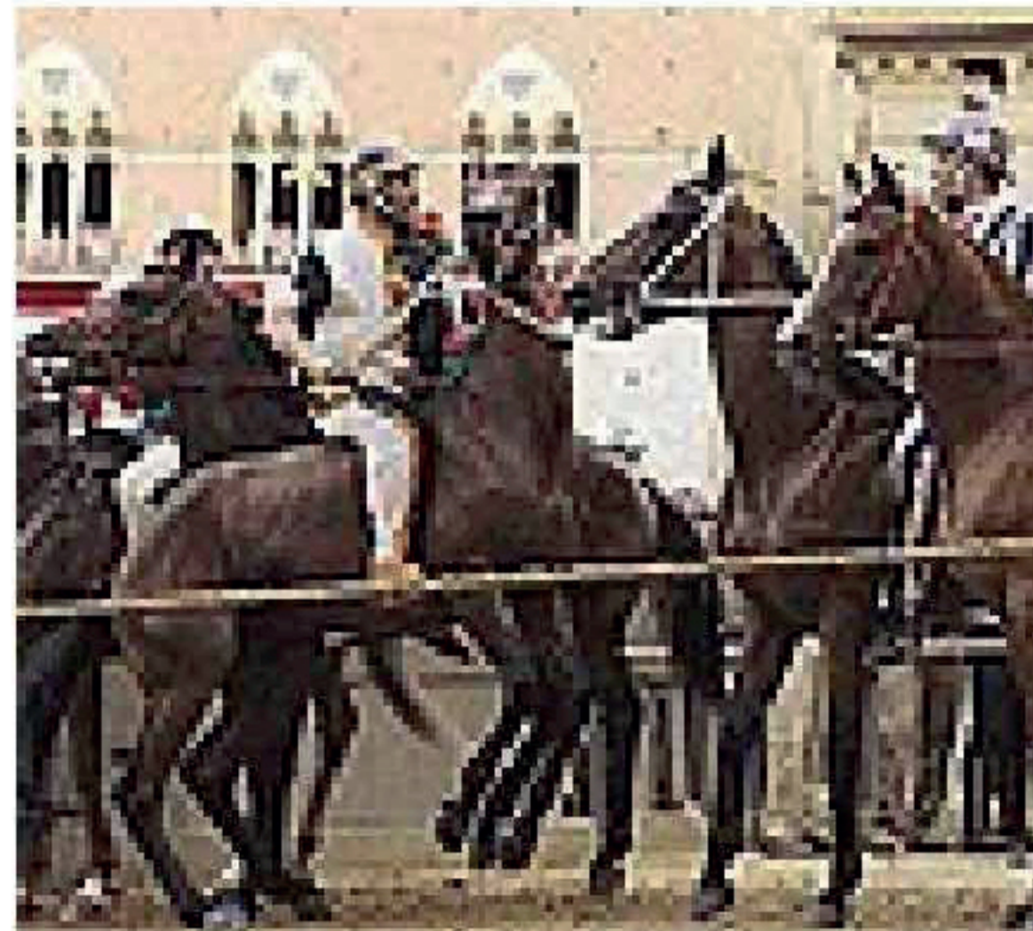
I cavalli del Palio

«No, però ho apprezzato molto i suoi lavori. In particolare, ammiro il fatto che abbia scelto il metallo per esprimersi. Un mate-